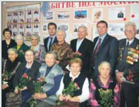
Остальных участников обороны Москвы представители администрации района поздравили на дому.