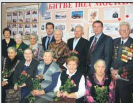
Остальных участников обороны Москвы представители администрации района поздравили на дому.