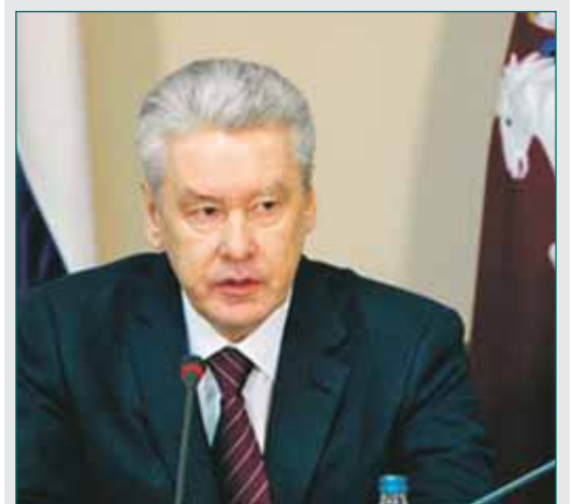
Мэр Москвы С.Собянин

13 октября в префектуре ВАО мэр Москвы Сергей Собянин провел выездное расширенное совещание с городскими и окружными руководителями, главной темой которого стала реализация Программы комплексного развития Восточного административного округа Москвы на 2011 год.