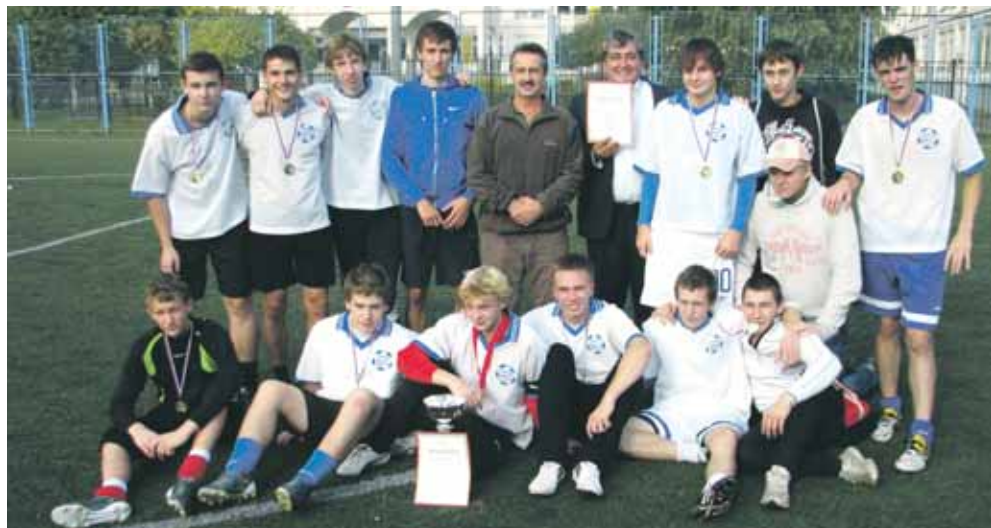
Чемпионы по футболу 2011 года. Команда ЦО №1925

23 сентября в финале окружных соревнований по флорболу, которые прошли в рамках спартакиады «Московский двор – спортивный двор» команда района Новокосино 1997-98 г.р. заняла II место. Поздравляем!