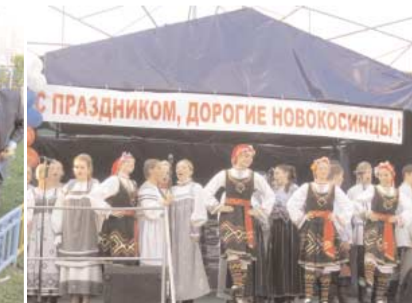
...не о сотрудничестве с... ...Надеюсь, что наши... ...такими же долговечны... ...евья, которые мы сегодня... ...наших побратимов в Но... ...тели дать новый импульс... ...му сотрудничеству. Я