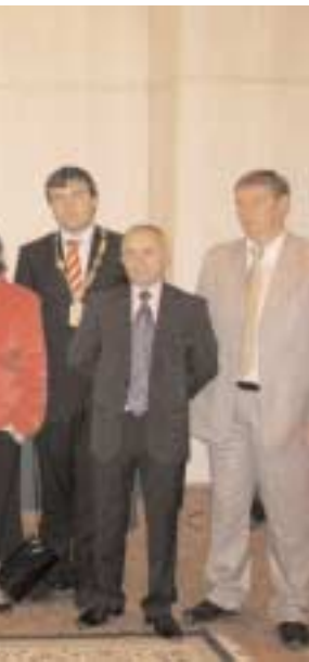
Новокосино Восточные по приглашению... районов, мы обменяем, с которыми... и знаниями чрезвычайного опыта и знания покояющегося общества».